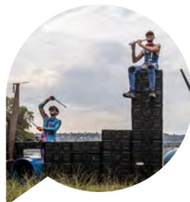
Plastic Boom Boom La réinvention musicale de déchets en instruments magiques