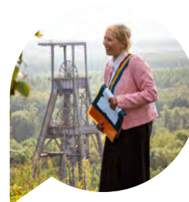
Soulever des montagnes Une ascension théâtrale vers le sommet du terril