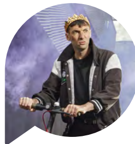
Sauver Richard Théâtre de rue... Une immersion shakespearienne revisitée